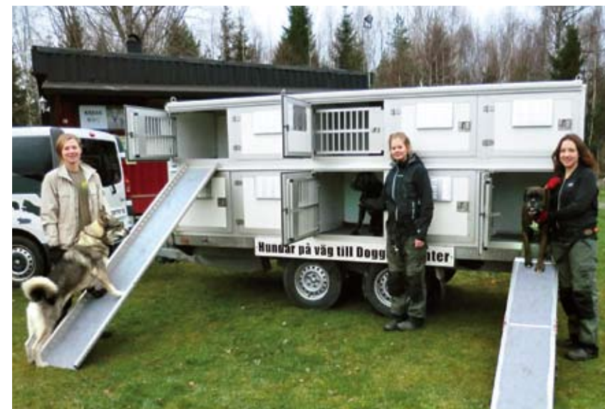
HÄMTSERVICE. Som extra service kan kunderna få sina hundar hämtade och lämnade i stan.